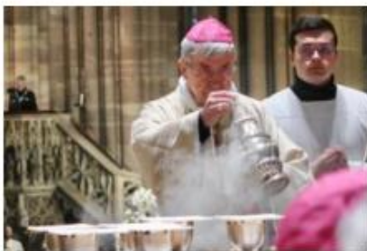
Photo prise lors de son installation