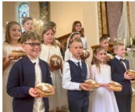
1 ère COMMUNION à Tagsdorf - 2024

Pour plus d'informations, veuillez contacter Caroline HELLSTERN au 06 33 54 75 30.