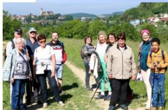
En marche vers St Morand

Puis à 15 h 30 une visite guidée du sanctuaire de Saint-Morand a été proposée.