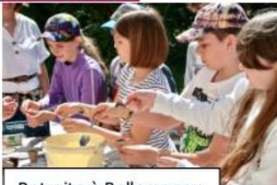
Retraite à Bellemagny

Cette réunion vise à fournir aux parents toutes les informations nécessaires sur les programmes de l'année à venir, le fonctionnement mais aussi présenter l'équipe. Il n'y a aucune limite d'âge pour s'inscrire au KT-Dimanche.